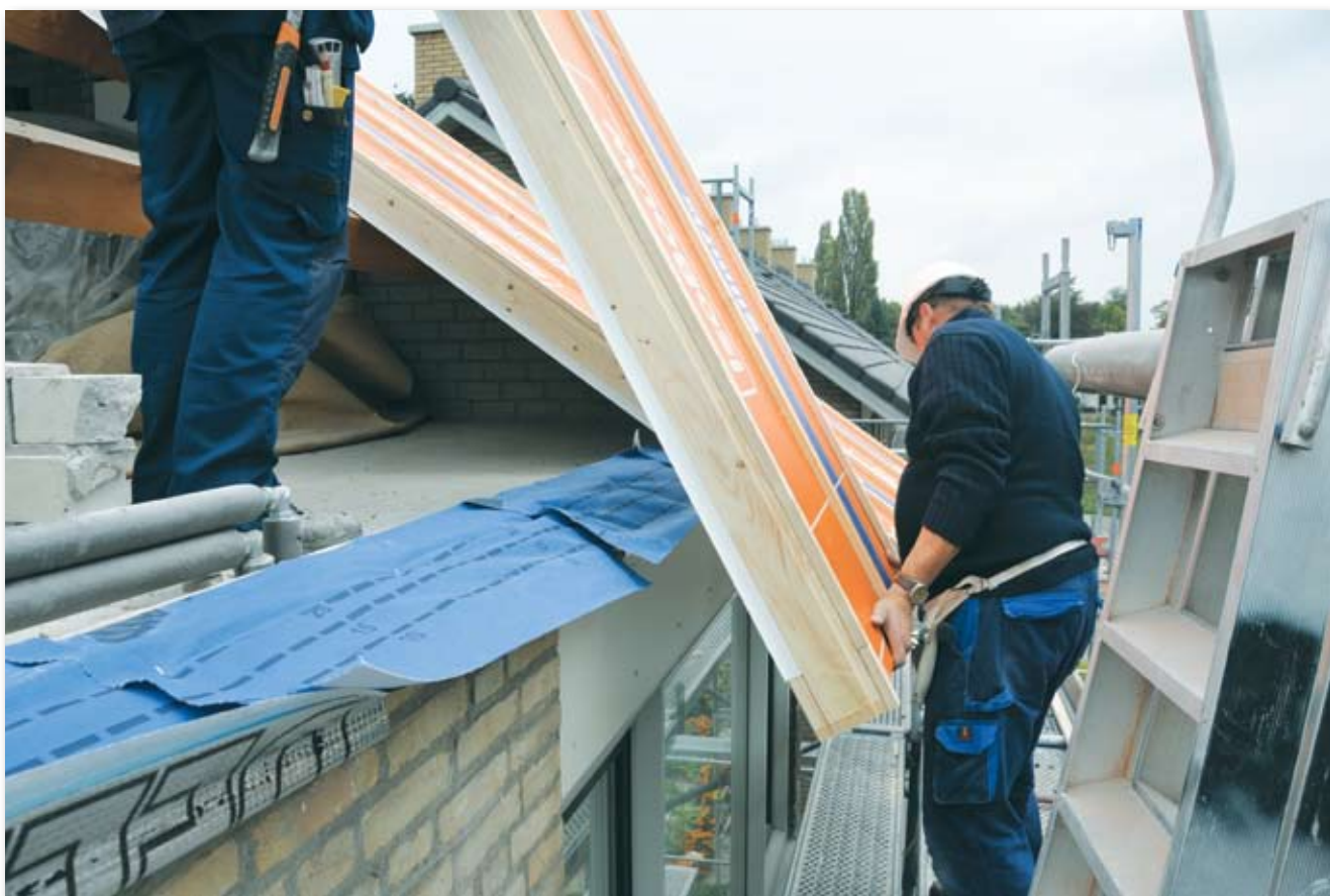
Het dakvoetprofiel in de praktijk.

Brandbaarheid, geluid, isolatie en luchtdichtheid zijn in zulke mate specialistische onderwerpen dat het bijna ondoenlijk is voor een bouwkundige of een architect om er allemaal