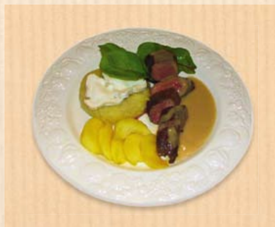
Hoofdgerecht, november 2008.