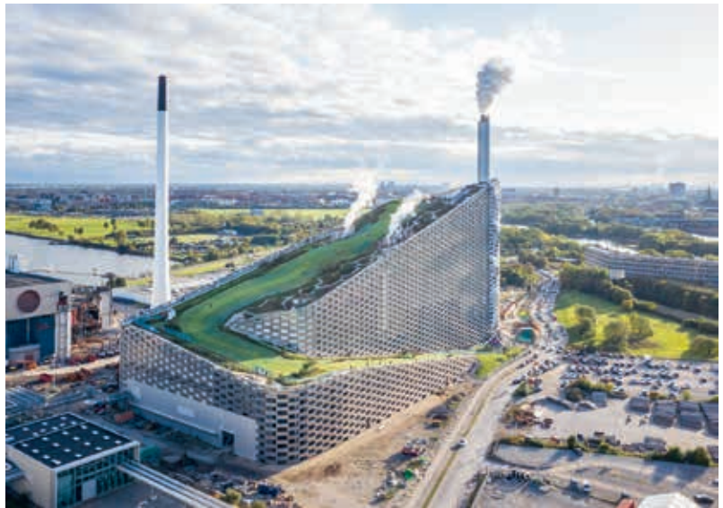
"We wilden functionaliteit toevoegen."

Ook zijn er honderden bomen geplant op de kunstmatige heuvel van CopenHill. De soorten zijn zorgvuldig geselecteerd door SLA Landschapsarchitecten, rekening houdend met hun veerkracht in deze omgeving. De bomen op de skipiste zijn in op maat gemaakte componenten geplaatst – gebogen roosters in gegalvaniseerd staal – die zorgvuldig aan het dakoppervlak zijn bevestigd. Het toegepaste daksubstraat zorgt ervoor dat de best mogelijke groeiomstandigheden worden gecreëerd op deze plek. De hoekige vorm van de gebroken delen in het substraat beperken erosie, zodat daar geen problemen mee ontstaan. De ondergrond voor skiërs bestaat uit een zorgvuldig geselecteerde skimat, geproduceerd in Italië. Dit alles is zorgvuldig gebouwd zodat er het juiste skigevoel op dit kunstmatige oppervlak is.