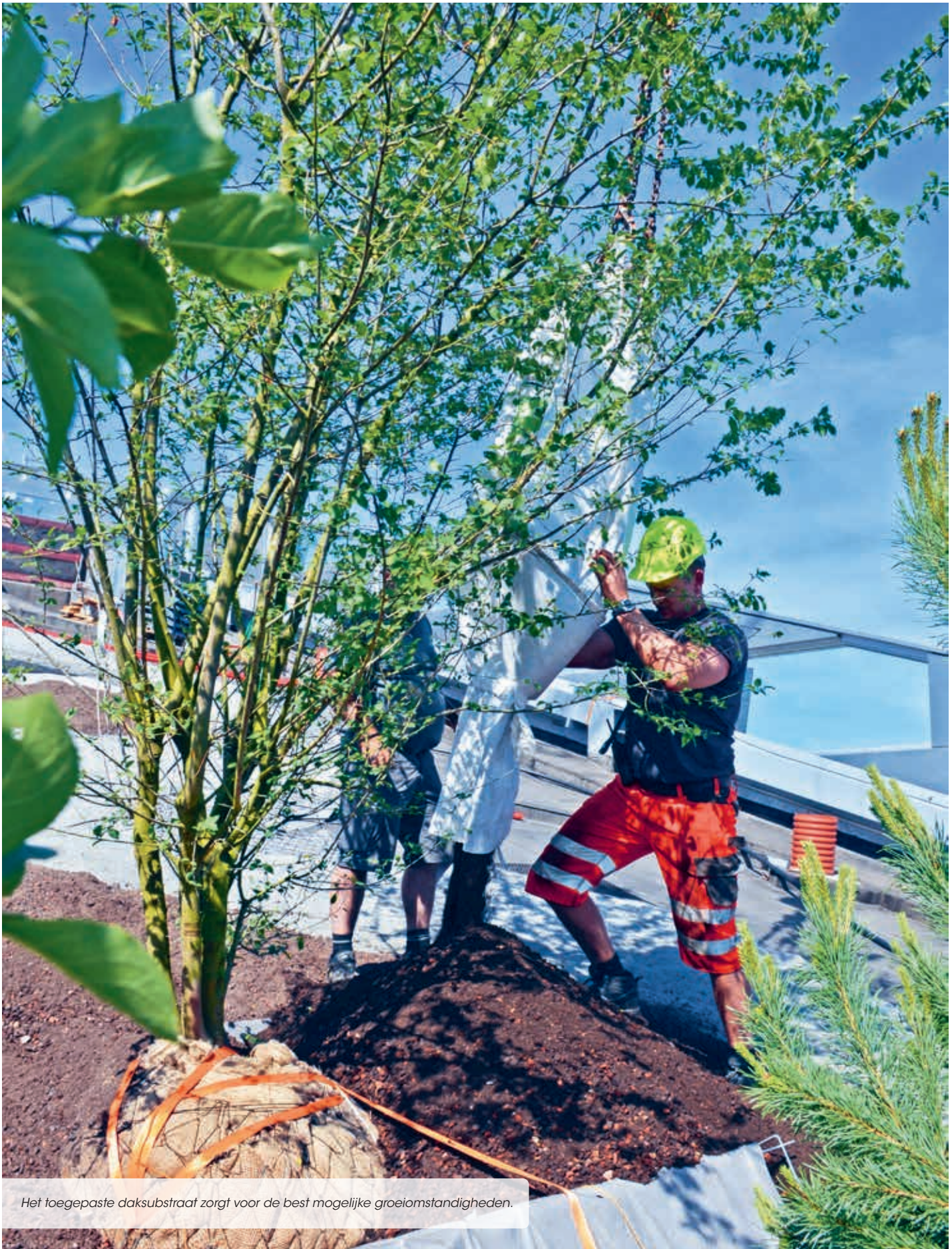
Het toegepaste daksubstraat zorgt voor de best mogelijke groeiomstandigheden.