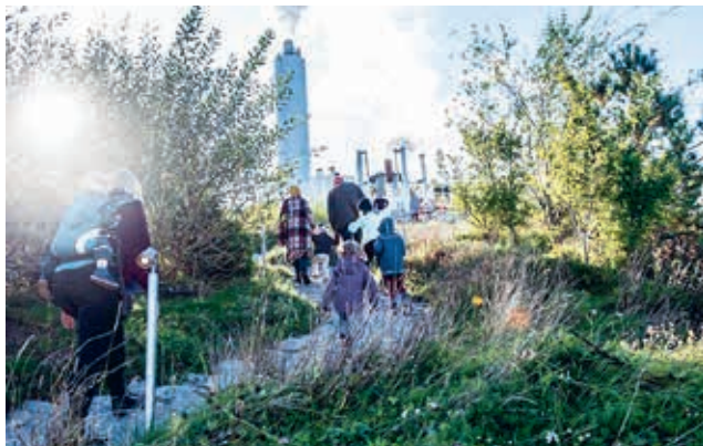
Niet alleen voor skiën, ook voor wandelen, klimmen, hardlopen of gewoon genieten van het uitzicht.

Een oude afvalverbrandingsinstallatie in Kopenhagen heeft onlangs een facelift gekregen om plaats te maken voor