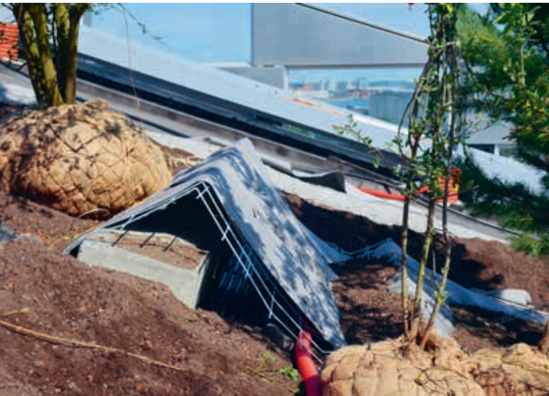
De bomen op de skipiste zijn in op maat gemaakte componenten geplaatst.

op het dak van het gebouw aan te leggen. "Hoe hijs je bijvoorbeeld een dennenboom van 2,5 ton een heuvel op en zorg je ervoor dat deze bij stormachtig weer niet naar beneden glijdt of kantelt?", aldus Malmos.