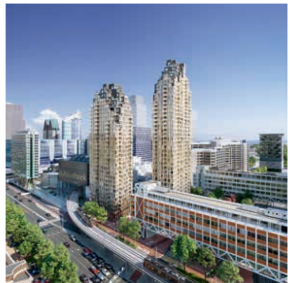
Grotius Toren, Den Haag