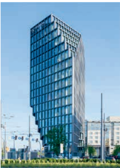
Baltyk Tower, Poznań

Opdrachtgevers zijn in de regel veel behoudender en voorzichtiger. "Dat dwingt ons om al vroeg principedetails te laten zien om de opdrachtgever en andere partijen te overtuigen. Dat gaat met de grote en groeiende voorbeeldbibliotheek waar we naar kunnen verwijzen wel steeds gemakkelijker. En opdrachtgevers weten inmiddels wat ze kunnen verwachten als ze bij ons aanbellen. Wij steken ook veel tijd en energie in het constructieve aspect en zorgen dat er een waterdicht gebouw ontstaat. Dat betekent dat alle details moeten kloppen. Het komt erop neer dat we soms al in een heel vroeg stadium de cruciale details oplossen. Bij de Valley in Amsterdam hebben we bomenexperts erbij gehaald,