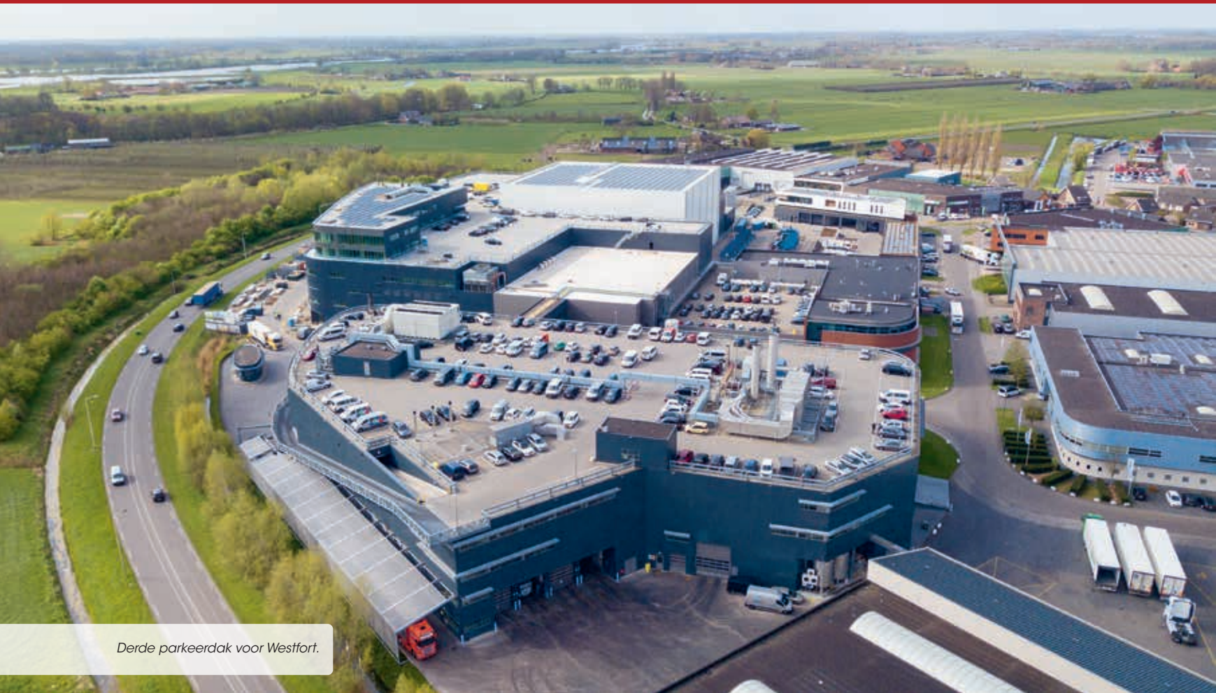
Derde parkeerdak voor Westfort.

Nadat Westfort Vleesproducten in 2015 de meest duurzame en innovatieve slachterij ter wereld in gebruik nam, werd ruim vijf jaar later de naastgelegen vleesverwerking fors uitgebreid met een volledig geautomatiseerd en geïntegreerd vrieshuis. Bunnik Bouw realiseerde het gebouw. Het ontwerp en de bouwbegeleiding lag volledig in handen van Promad. Om de duurzaamheidsambities van Westfort waar te maken, is het pand gebouwd op basis van BREEAM-NL Outstanding. Net als bij de twee eerder gerealiseerde gebouwen, kreeg ook bij deze uitbreiding het dak een parkeerfunctie.