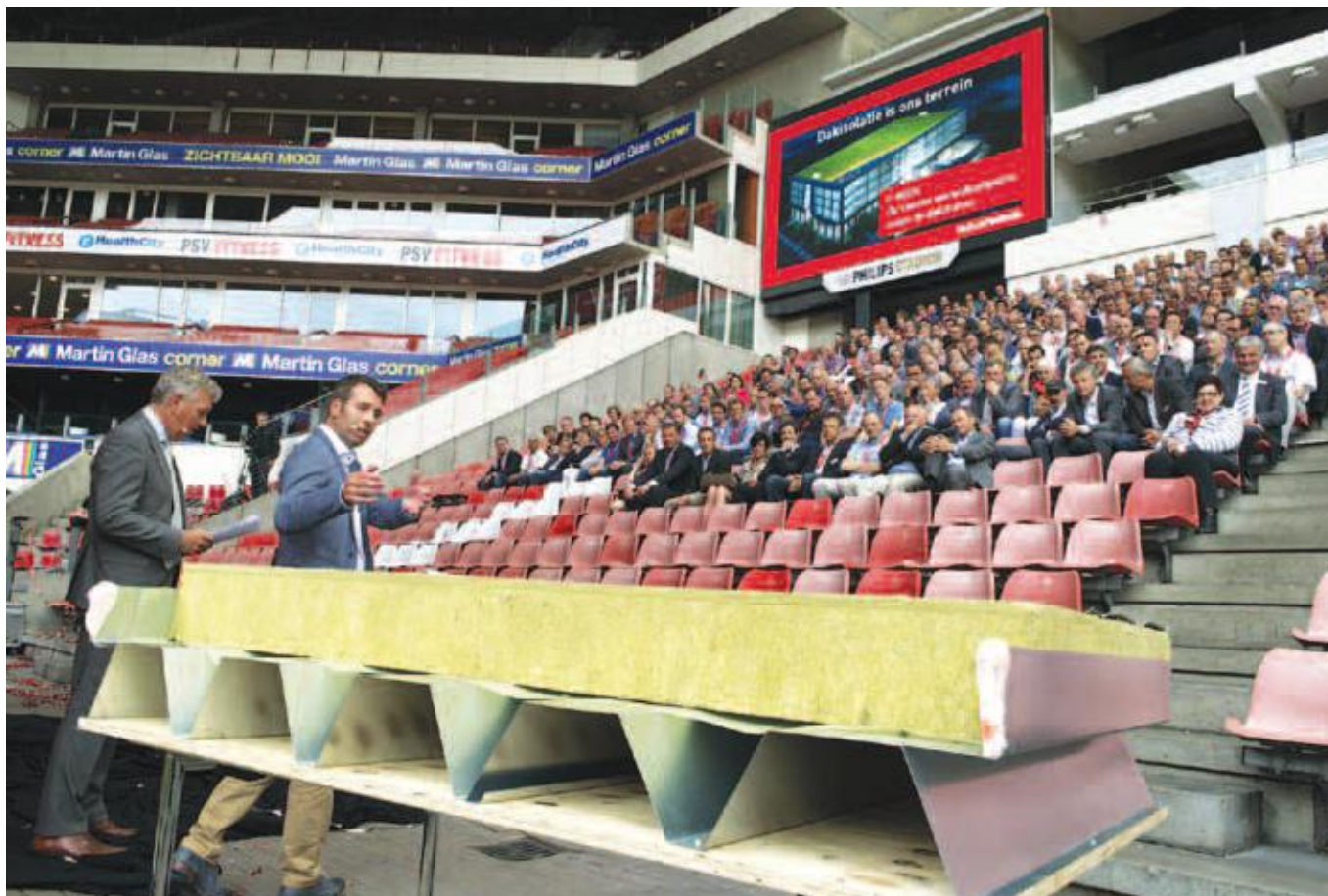
Op 21 mei werd de nieuwe dakplaat T-Rock onder grote belangstelling gelanceerd in het Philips Stadion.