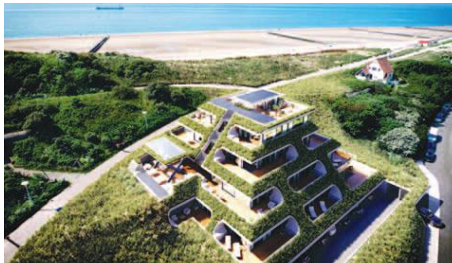
Duinhotel Tien Torens, Zoutelande.

"Deze werkwijze betekent voor alle betrokkenen een tijd- en dus geldbesparing. Dat is echter nog niet iedereen zich bewust. Zo kost het ons soms nog wel eens moeite om aanvullende stukken bij de overheid opgevraagd te krijgen. Men staat dikwijls op het standpunt dat wij als niet inschrijvende partij geen recht hebben op deze stukken. Naar mijn idee is