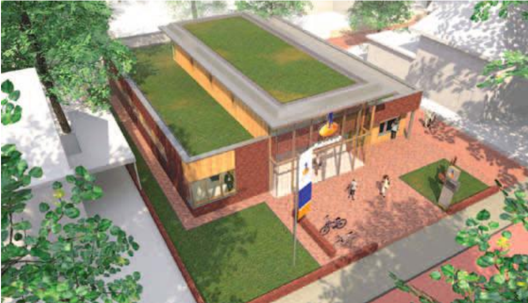
Rabobank te Huizen.

Van Keulen: "Wij werken uitsluitend met digitale bestanden die ons door aanbesteders en aannemers worden toegezonden of die wij verkrijgen via het internet. Wij werken met geavanceerde hulpmiddelen om uit de digitale bestanden een uittrekstaat/calculatie te genereren. Inmiddels beschikken we over vele jaren ervaring in de praktijk van het calculeren voor dakdekkerbedrijven en we kunnen dan ook garant staan voor de kwaliteit van onze calculaties."