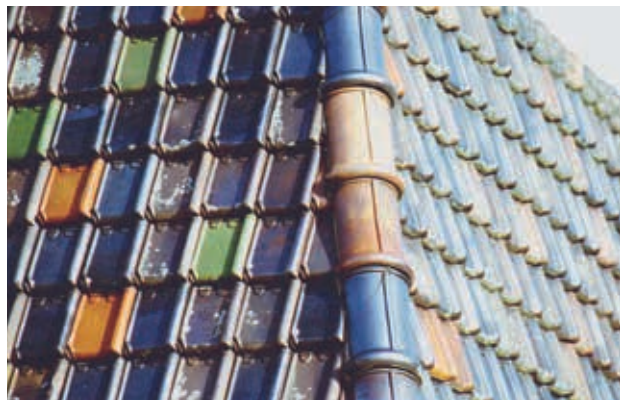
Hoekkeper met halfronde vorsten en Tuile du Nord (es) dakpannen. Hier is de dakhelling bijna 90 graden en heeft men het aangedurfd geen ondervorsten of specie toe te passen.

en Rijnlandpannen) ook platte vorsten adviseren. Bij golfpannen (o.a. O.V.H. en V.H. Romaanse en Renova) de halfronde vorsten of klaverbladvorsten. Dan heb je ook nog ballon-, zadel- en omloopvorsten. Helemaal mooi wordt het als je de Begin-hoekkeper-vorst met een krul of ornament toepast. Dan heb je een dak dat bij elke thuiskomst voor jezelf of bezoek een feestje is om naar te kijken! Maar daarover een andere keer. ●