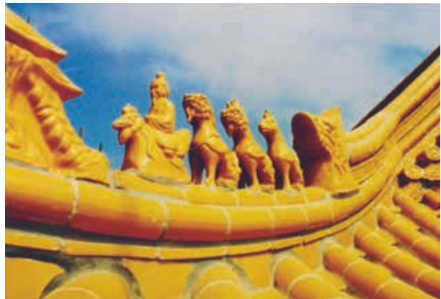
Hoekkeper met fabeldieren op Boedha-tempel aan de Zeedijk te Amsterdam, met vooraan de keizer zittend op de haan. (Foto: H.Momers).

Is elke vorst mooi om op de keper te leggen? Nee. Als je de brede, platte driekantvorst op de keper legt, dan wordt het allemaal een beetje te breed en lomp. Een halfrondevorst kan nog wel, mits niet te breed. De fabrikant zal bij platte dakpannen (o.a. Mulden-, Kruis-, Tuile du Nord-