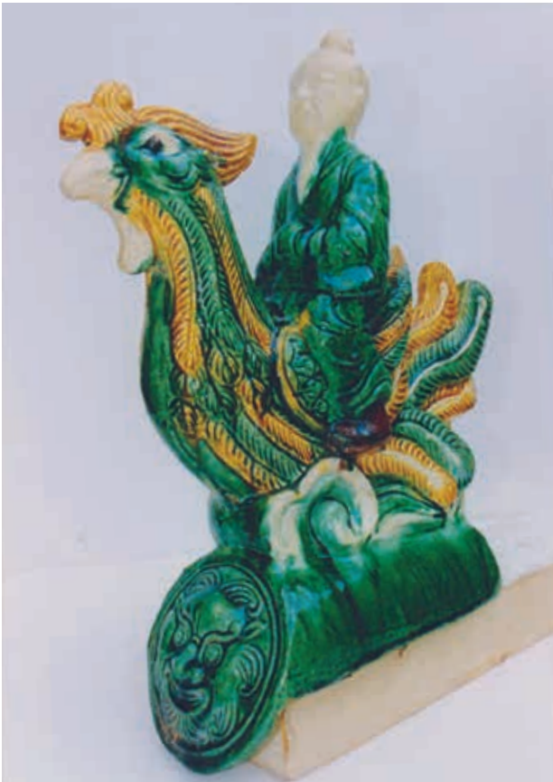
In diverse kleuren glazuur beginhoekkepervorst met medaillon om de kopse zijde van de keperbalk aan het zicht te onttrekken, China. (Collectie H. Momers).

bij en dan zie ik graag dat die ouderwets wordt aangesmeerd met rijkelijk kalk/zand- specie, gewoon omdat het er veel authentieker uitziet op zo'n monumentaal dak.