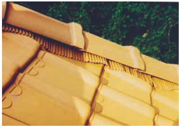
Platte driekant hoekkepervorst met flexibele ondervorst.