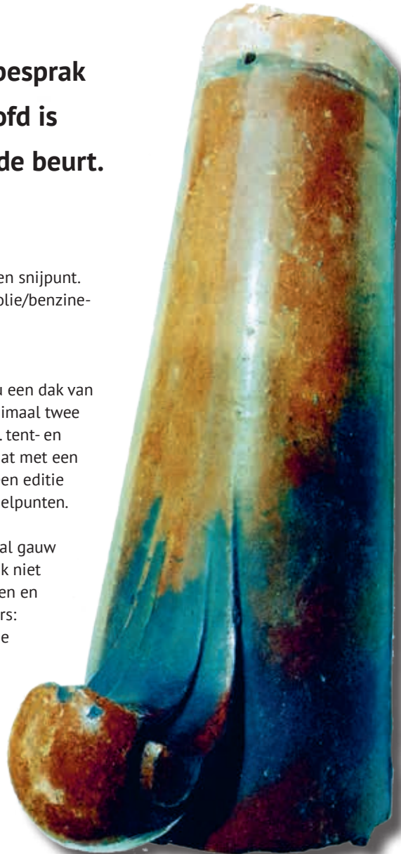
Schubvorst voor hoekkeper met grote krul, waterkering ontbreekt. Lichtbruin glazuur, 45 cm. lang. Fabrikaat, Duitsland. (Collectie H.Momers).