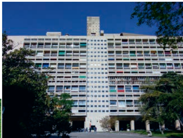
Het uitzicht over de stad is fraai, maar ook de sculpturale kokers en de gymzaal met zijn ronde dak bieden een mooi aanzicht.

in 1955, Unité d'Habitation of West-Berlijn (Duitsland) in 1957, Unité d'Habitation of Briey (Frankrijk) in 1963 en Unité d'Habitation of Firminy-Vert (Frankrijk) in 1965.