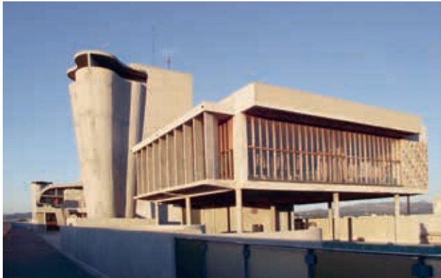
Unité d'Habitation in Marseille.

Le Corbusier ontwierp een blauwdruk voor een wooneenheid, waarin de uitgangspunten voor de moderne architectuur verankerd lagen. Zijn Unité d'Habitation –letterlijk vertaald: wooneenheid – is een verticale stad voor zo'n 1.600 mensen. Eigenlijk is het een galerijflat op poten, met daarbij veel gemeenschappelijke voorzieningen. Zo is het voorzien van een winkel, een crèche, een bibliotheek, een sportgelegenheid, een restaurant en niet te vergeten, een daktuin. Niet alleen Le Corbusiers architectonische en planologische uitgangspunten zijn in het gebouw verankerd, ook zijn visie op wonen, samenleven en stadsontwikkeling komen erin terug. Vele architecten (ook Nederlandse) laten zich graag inspireren door Le Corbusier. Het utopische stadswoonontwerp werd herhaald in nog vier gebouwen met deze naam en een zeer vergelijkbaar ontwerp: Unité d'Habitation of Nantes-Rezé (Frankrijk),