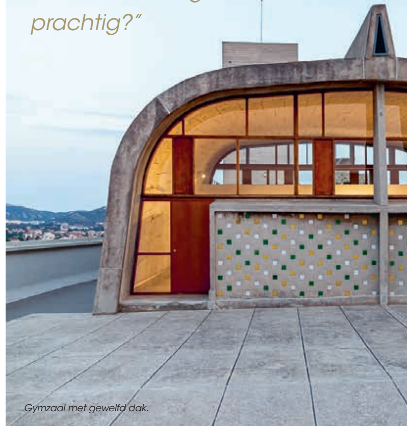
Gymzaal met gewelfd dak.

"Gelukkig hadden we geen geld! Want waren die fouten niet gewoon prachtig?"