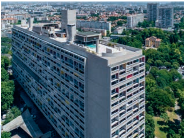
Brutalistisch gebouw met een bijzondere daktuin.

Le Corbusier dacht er lang over na hoe hij hiermee om moest gaan. Hij besloot uiteindelijk van een nood een deugd te maken, door het vanuit een kunstzinnig oogpunt te bekijken. In zijn speech bij de opening van l'Unité komt Le Corbusier uiteindelijk tot de conclusie: 'Gelukkig hadden we geen geld!' (om die onvolkomenheden glad te strijken). Want waren die fouten niet gewoon prachtig? Zeker als je ze in je voordeel gebruikt en ze combineert met een weldoordacht kleurpa-