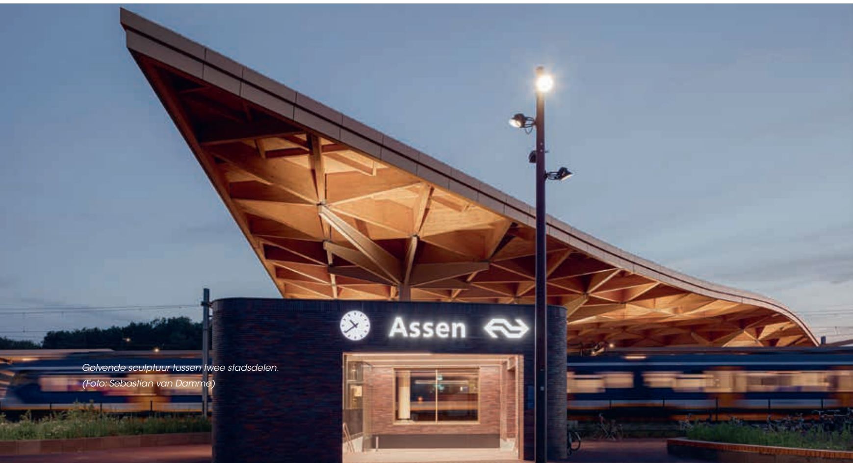
Golvende sculptuur tussen twee stadsdelen.

Tijdens het succesvol verlopen DAKEN & ZAKEN op 11 november is Station Assen uitgeroepen tot Dak van het Jaar 2020. Het station met zijn golvende houten kap bleek nipt de winnaar boven het dak met bomen op het Depot van Museum Boijmans van Beuningen, met een goede derde plaats voor Lorentz in Leiden. Station Assen heeft de uitverkiezing volgens de jury te danken aan hoge scores op alle aspecten waarlangs projecten worden afgemeten: gebruikte technieken, duurzaamheid, veiligheid, samenwerking en esthetiek.