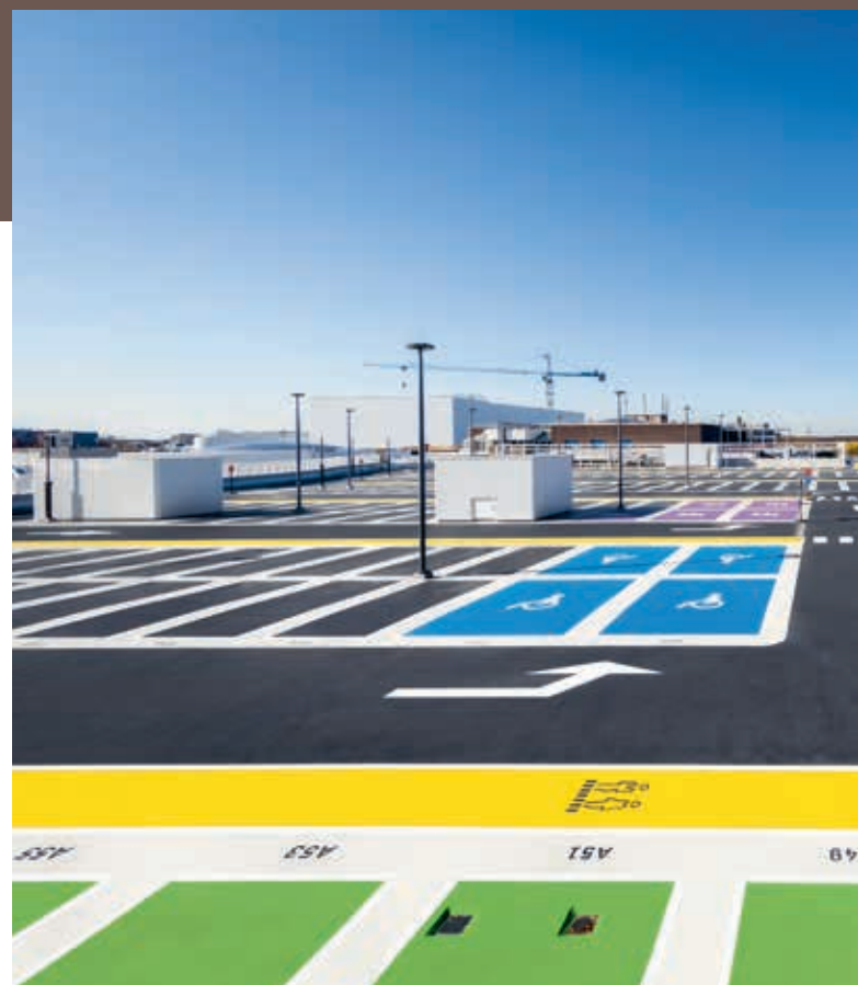
Het hoogste parkeerdek van Westfield Mall of the Netherlands.

Het is van belang dat een parkeerdak een veilige omgeving is voor bezoekers. Door het aanbrengen van een antisliplaag is het mogelijk om comfort en veiligheid naar een hoger niveau te tillen. Naast de grotere oppervlakken, kunnen trappen ook worden afgewerkt met Triflex.