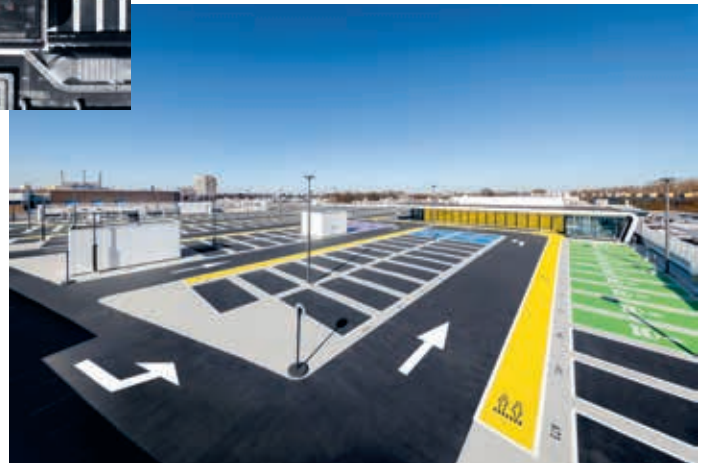
Een intensief gebruikte parkeervloer vraagt om het best mogelijke afwerkingsniveau.