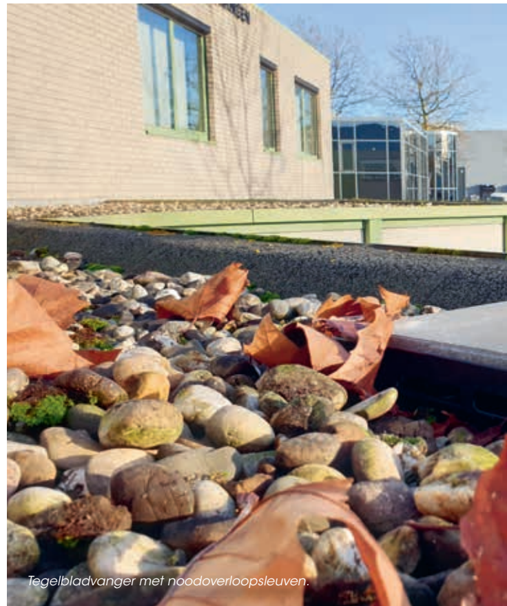
Tegelbladvanger met noodoverloopsleuven.