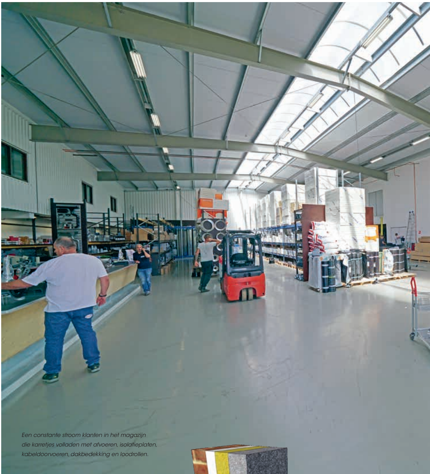
Een constante stroom klanten in het magazijn die karretjes volladen met afvoeren, isolatieplaten, kabeldoorvoeren, dakbedekking en loodrollen.