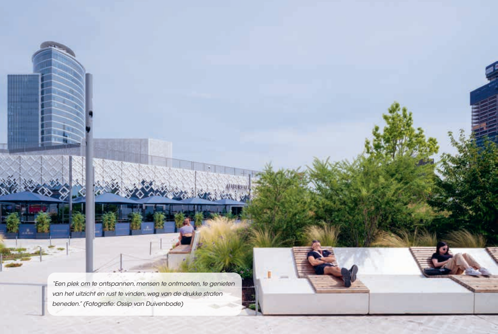
"Een plek om te ontspannen, mensen te ontmoeten, te genieten van het uitzicht en rust te vinden, weg van de drukke straten beneden."