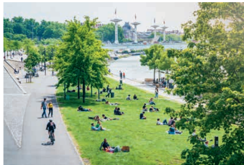
Inspiratiebron: de oevers van de Rhone.